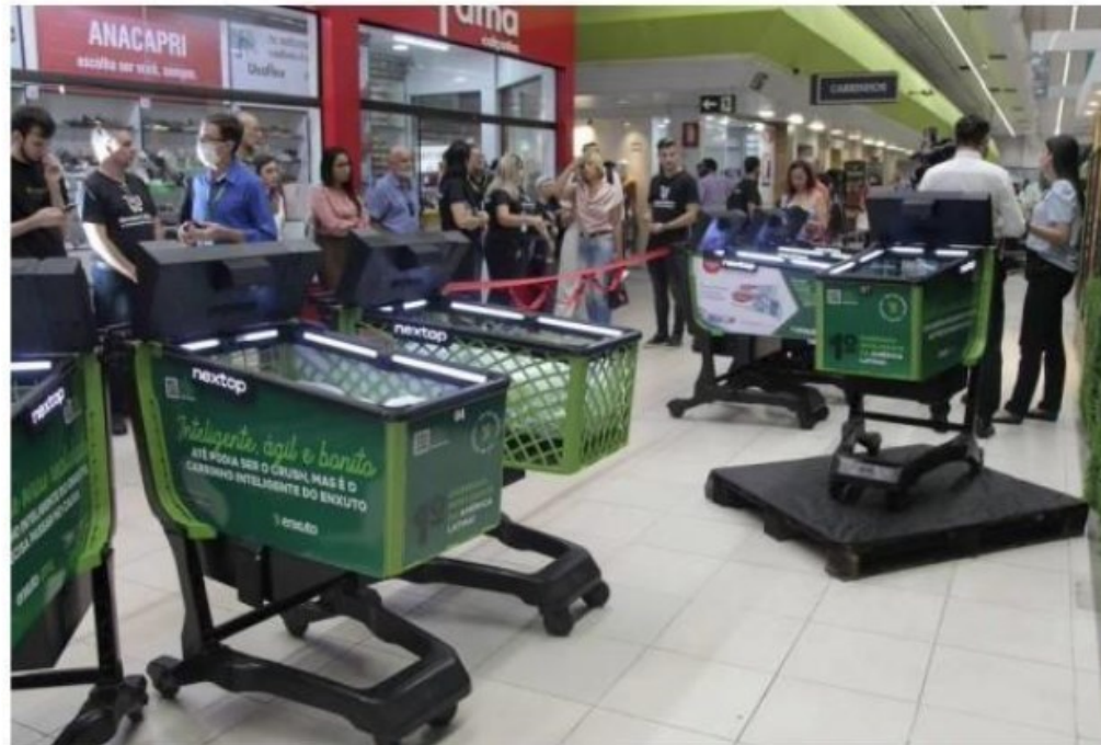
Carrinho de supermercado permite finalizar as compras no próprio veículo

Segundo a rede, o equipamento tem um leitor de código de barras e uma tela touch screen para o cliente acompanhar a compra e fazer o pagamento, além de câmeras e uma balança, que monitoram os itens colocados e retirados.